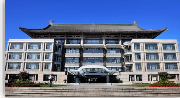
Пекінський університет в Китаї