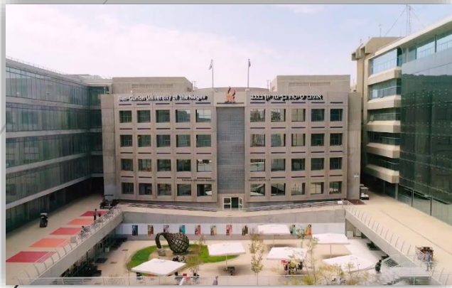
Університет Бен Гуріона в Негеві