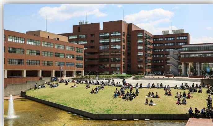
Університет Цукуби в Японії